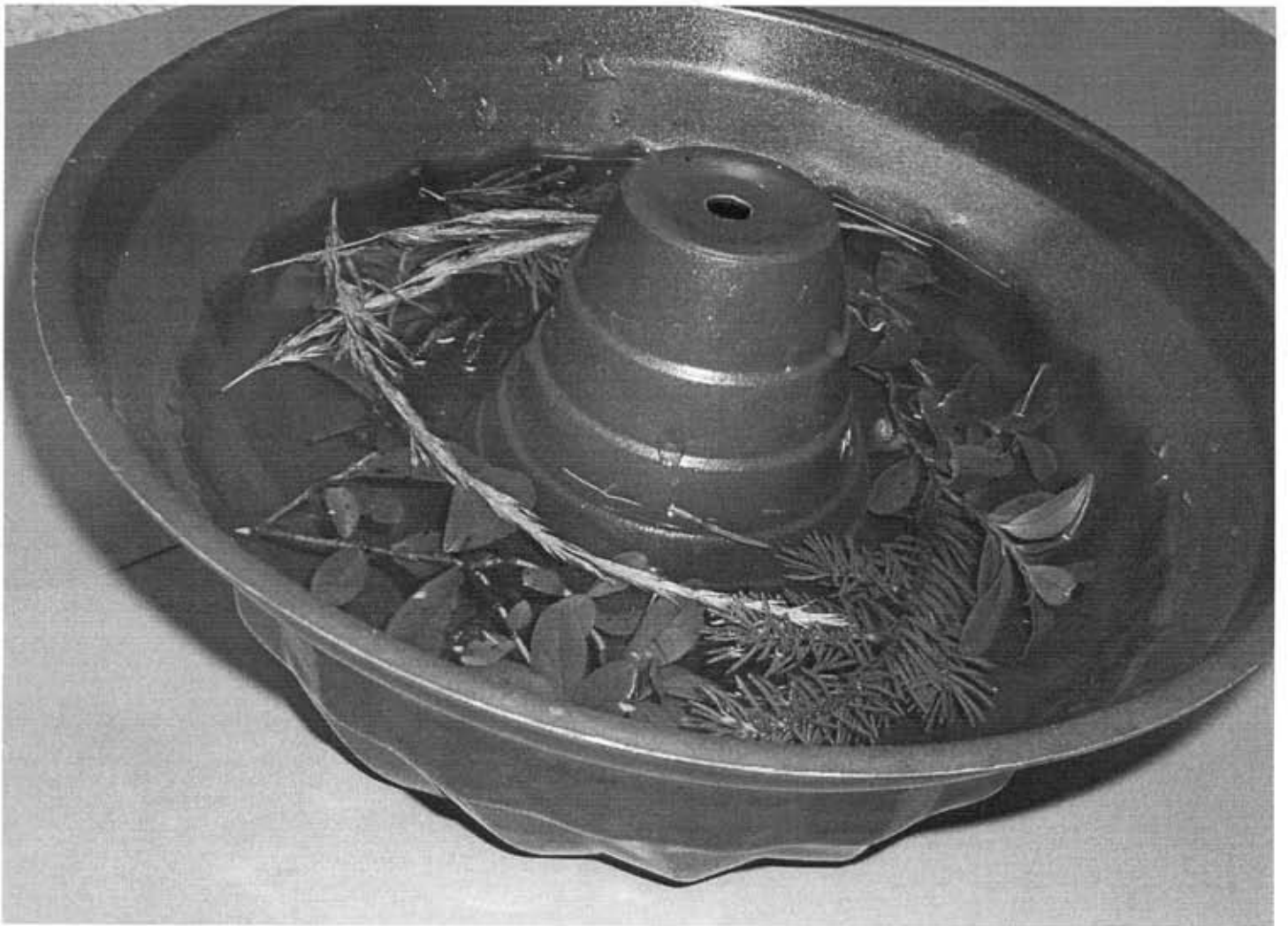
1-2: TÄYTÄ KAKKUUOKA LUONNON KORISTEILLA